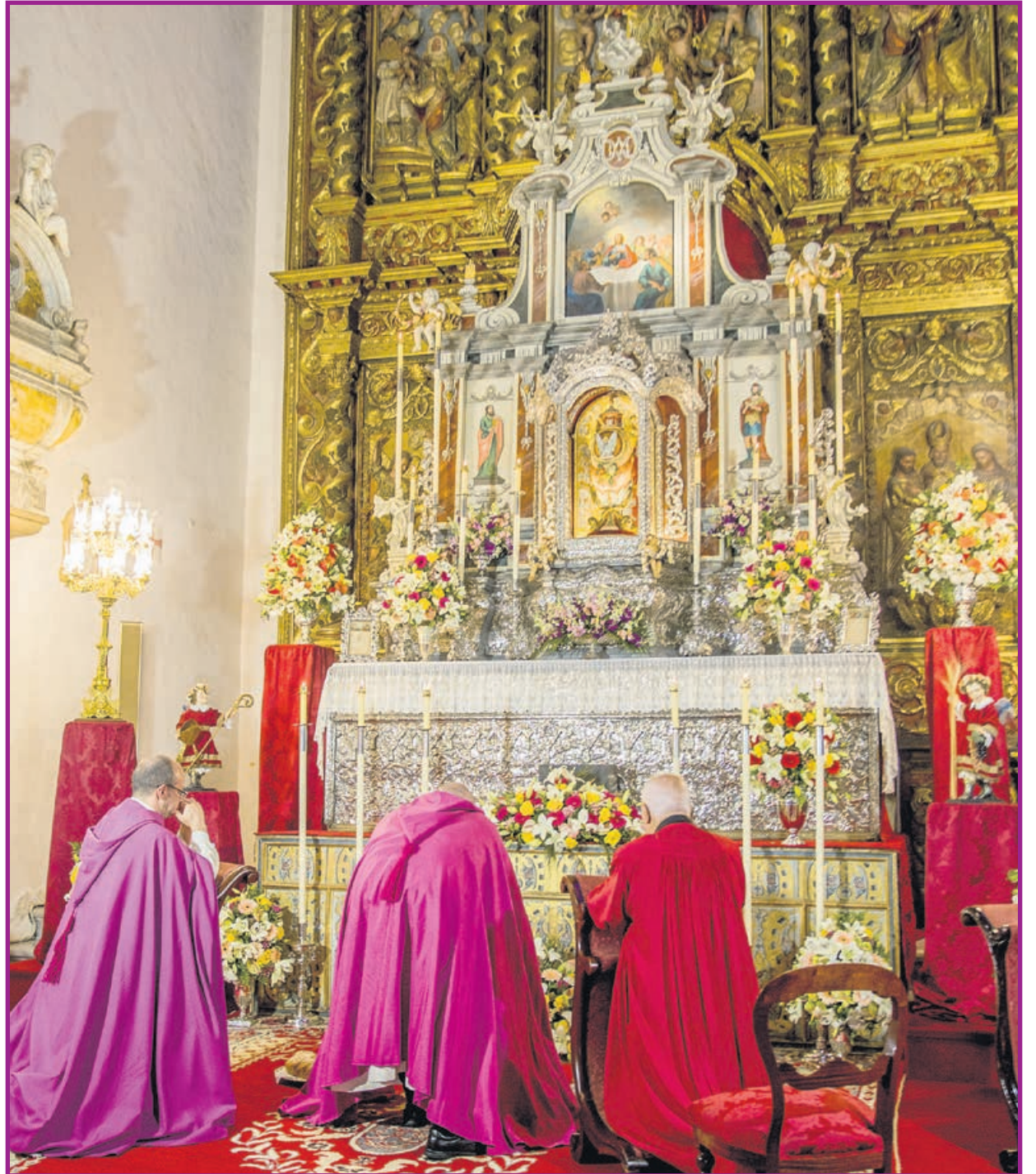
MONUMENTO DE LA PARROQUIA DE LA CONCEPCIÓN, LA OROTAVA. Isidro Felipe Acosta

Esto es un hecho digno de mención ya que, tras las reformas litúrgicas del siglo XX - como la promulgada por el Papa Pío XII en 1955 llamada Maxima Redemptionis Nostrae Mysteria , publicada en 1955, y cuya aplicación litúrgica vino dada por el Ordo Hebdomadae Sanctae Instauratus o el propio Concilio Vaticano II-