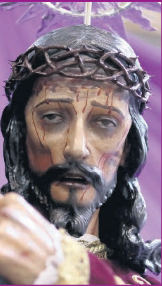
LA IMPRESIONANTE TALLA DEBIÓ HABER SIDO REALIZADA EN UN TALLER CANARIO DURANTE EL SIGLO XVII.

1995 quedó conformada y bendecida la nueva cofradía y al año siguiente, quien estas líneas escribe, había concluido la imagen del Cristo de las Caídas, de la Parroquia de Nuestra Señora del Rosario de Fátima.