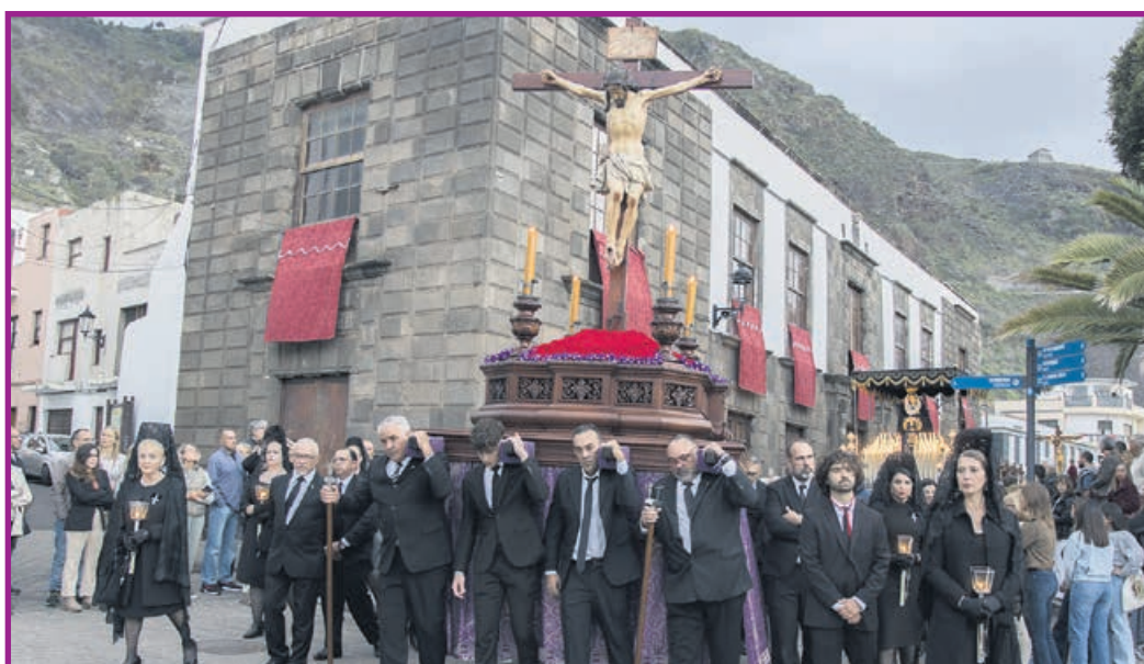
SOBERBIO CRUCIFICADO BARROCO DE MARTÍN DE ANDÚJAR.

Veinticinco pasos, siglos de arte y el esfuerzo de todo un pueblo para testimoniar y dar vida al relato de la Pasión y Muerte de Jesucristo más extenso de toda Canarias