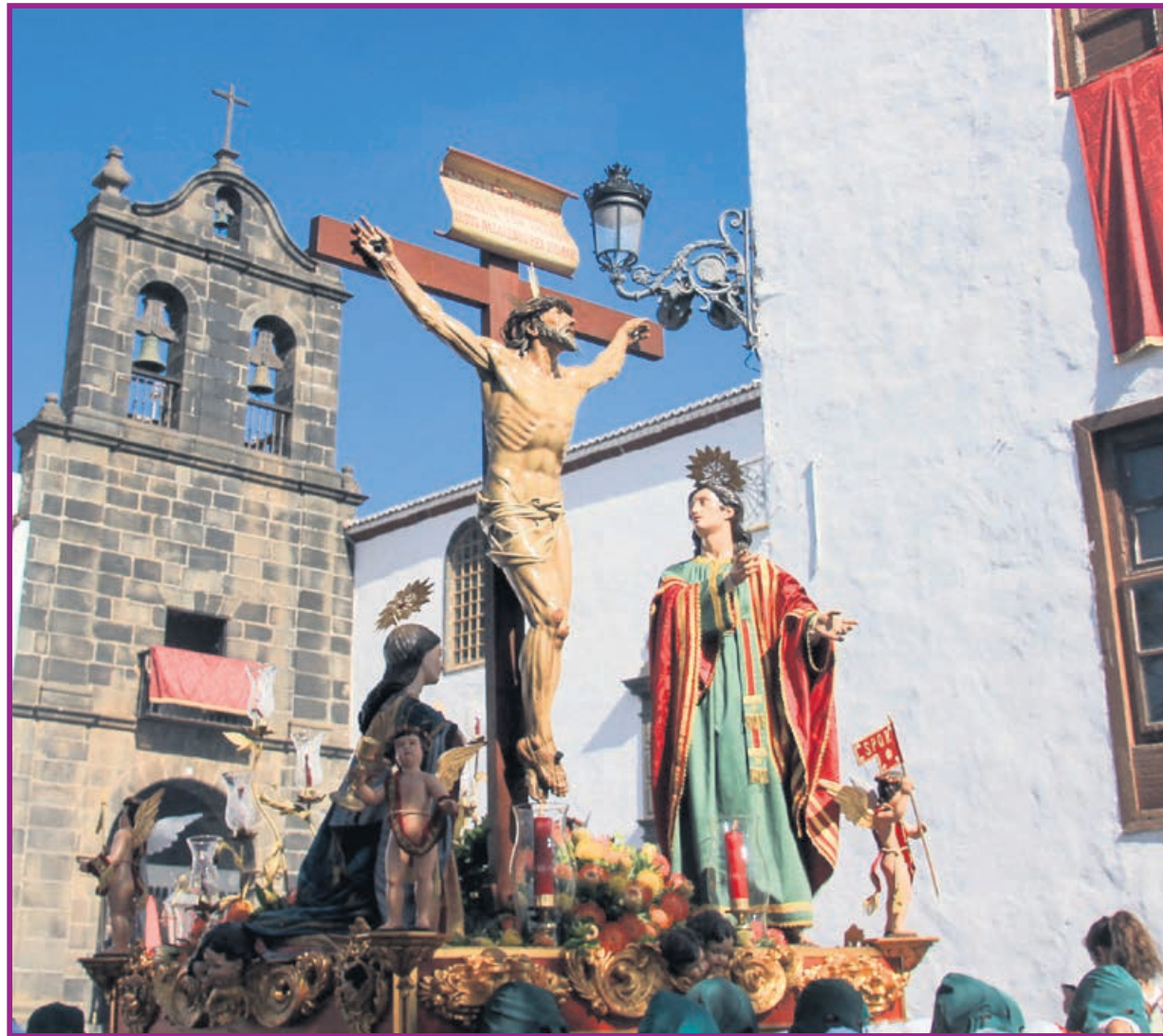
LA BELLA ESCULTURA DE CRISTO APARECE EXPIRANTE, MIRANDO AL CIELO, BUSCANDO AL MISMO DIOS. José Ayut