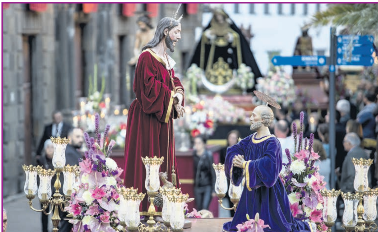
EL SEÑOR PRESO Y LAS LÁGRIMAS DE SAN PEDRO LLEGARON DE TALLERES DE LA HABANA.