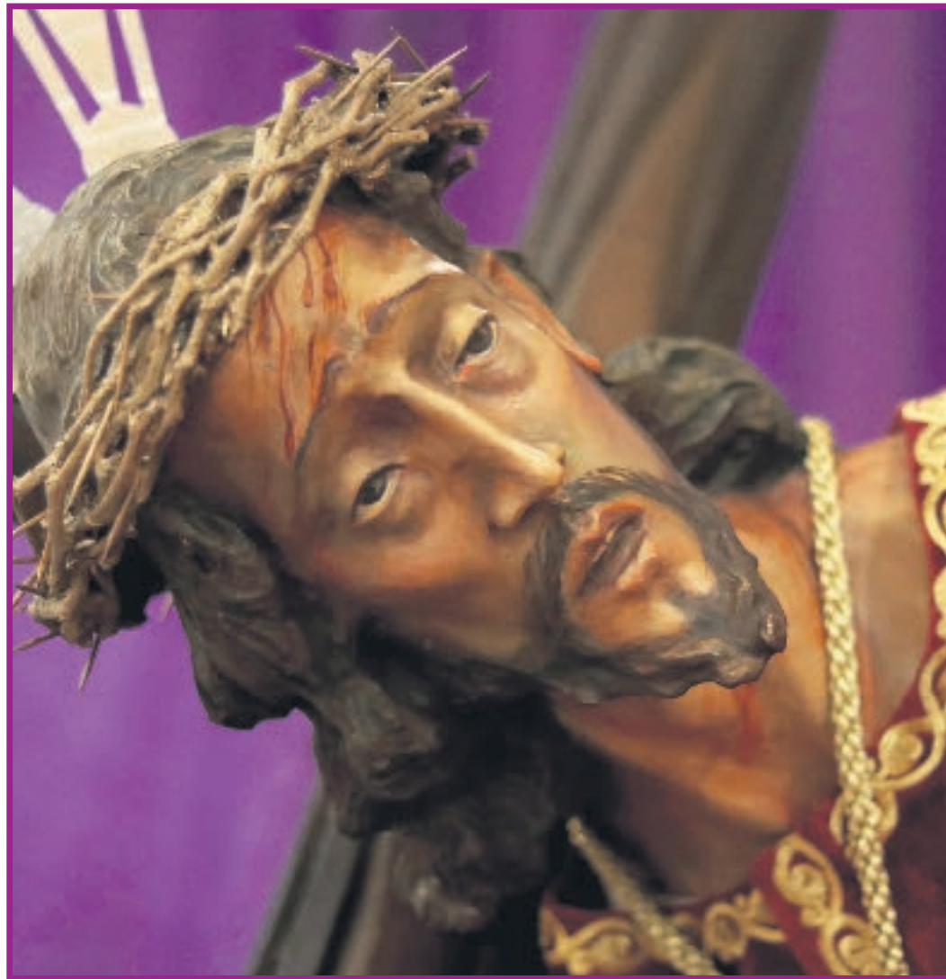
CRISTO DE LAS CAÍDAS, DE LA PARROQUIA DE NUESTRA SEÑORA DEL ROSARIO DE FÁTIMA. Kevin Rodríguez

El Encuentro era una de las citas tradicionales de nuestra Semana Santa. Tenemos una sorprendente descripción de esa procesión, del año 1888, por el viajero inglés Charles Edwar-